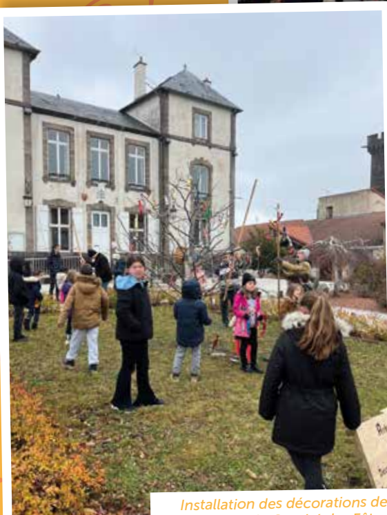
Installation des décorations de Noël avec le Comité des Fêtes