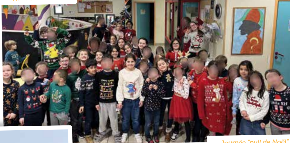
Journée "pull de Noël"