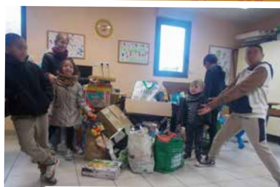
Petite partie de la collecte de jouets et de vêtements au profit des restos du cœur