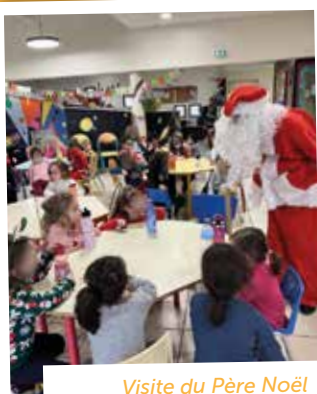
Visite du Père Noël