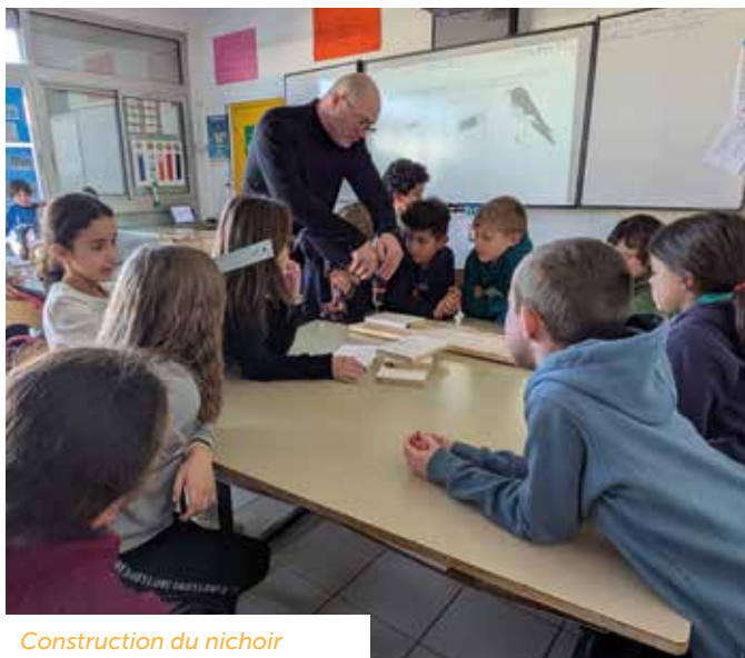
Construction du nichoir

Pour rappel, la fête de l'école se déroulera, vendredi 20 juin avec un spectacle par deux classes de 18h à 20h. La kermesse, organisée par l'AIPEC, aura lieu soit le vendredi 6 juin soit le vendredi 13 juin.