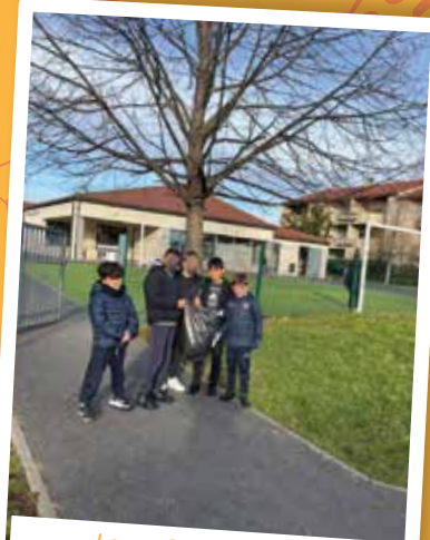
Les enfants ont ramassé les déchets aux abords du centre

06 08 00 67 15 • service-enfance-jeunesse@chateaugay.fr