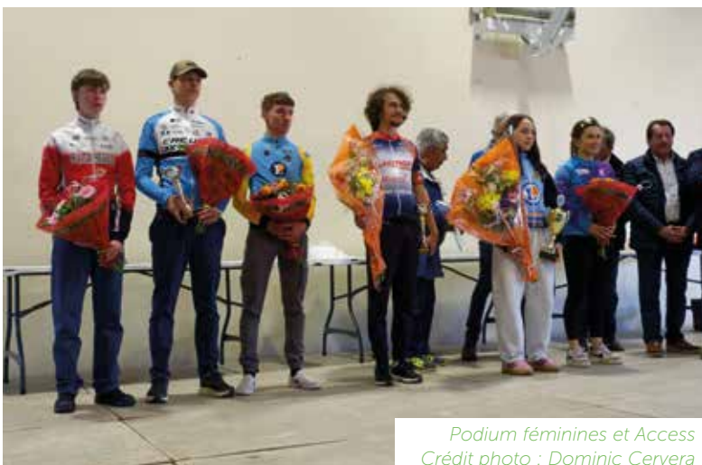
Podium féminines et Access