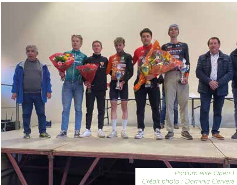
Podium élite Open 1

Après avoir terminé la course, les coureurs ont rejoint le podium salle J.-Escuit où le premier de chaque catégorie a reçu une coupe et le traditionnel bouquet.