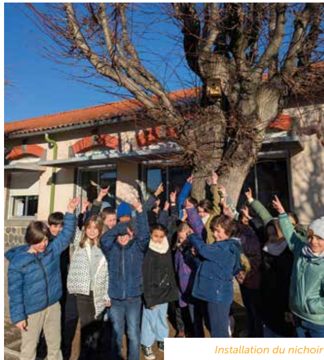
Installation du nichoir

construit des nichoirs avec l'animateur nature et avec l'aide des parents (prêt, don de matériel, présence). Ces nichoirs ont été installés dans les arbres de la cour de récréation ainsi que dans celle de l'île aux enfants. Il n'y a plus qu'à attendre le printemps pour qu'ils soient occupés !